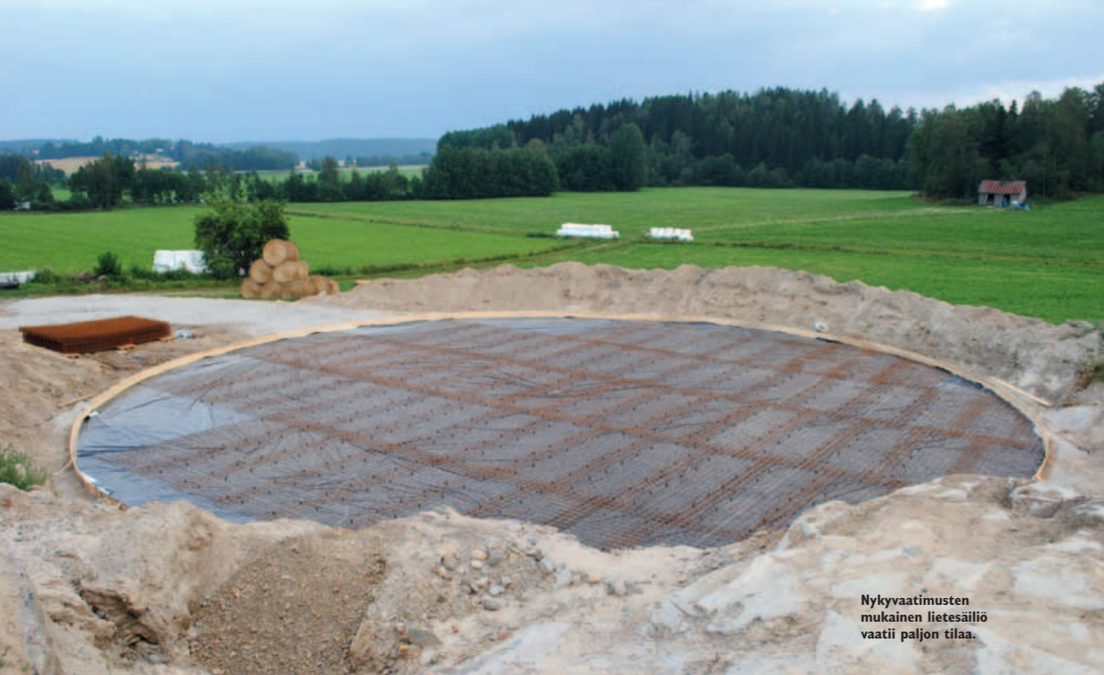
Nykyvaatimusten mukainen lietesäiliö vaatii paljon tilaa.